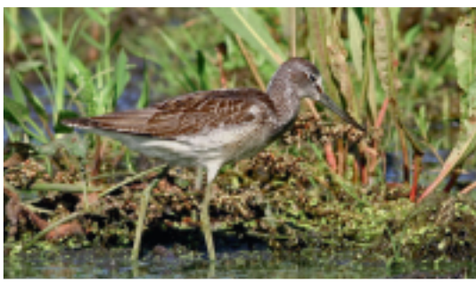
Gluttsnäppa, en art som var relativt vanlig i början av vår verksamhet

Kronobergs län. Interimsstyrelsen valdes då till klubbens första ordinarie styrelse.