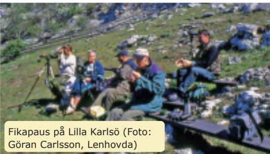
Fikapaus på Lilla Karlsö