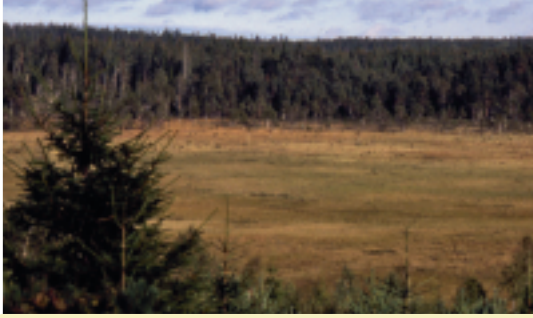
Här stod vi många morgnar på bergsknallen och spanade ut över Fiskesjö