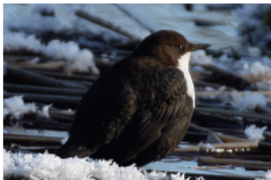
Möjligt möte med strömstare den 19 mars