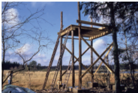
Tornet vid Södresjö börjar ta form

Ölandsresa gjordes i maj 1989 och detta har sedan, med jämna mellanrum, blivit en återkommande programpunkt. En höstresa till Falsterbo, som vi besökte första gången oktober 1990, har också återkommit ungefär vartannat år.