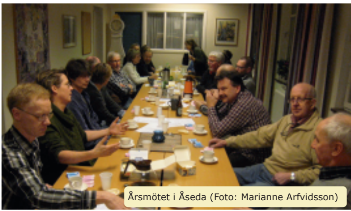
Årsmötet i Åseda