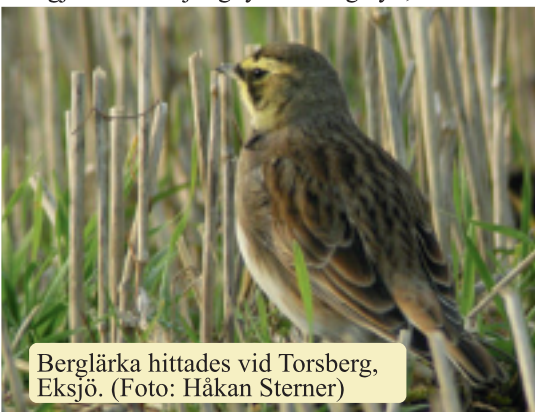
Berglärka hittades vid Torsberg, Eksjö.

Tvåa blev Markaryd på 104,2 % och trea blev Tjust FK på 103,9 %.