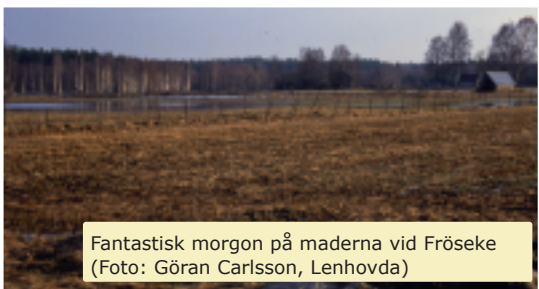
Fantastisk morgon på maderna vid Fröseke

Under 1993 påbörjade vi ett nytt större projekt, nämligen artlistning av fåglarna i Hemsjön-Varsjön området. Under tre häckningssäsonger besökte vi området och detta utmynnade sedan i en skriftlig rapport. Vad gäller vårresan så bytte