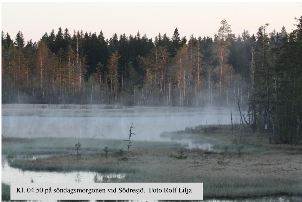
Kl. 04.50 på söndagsmorgonen vid Södresjö.

Vid ett tillfälle passerar tre skrattmåsar över sjön. För bara några år sedan låg skrattmåsans läte som en ljudlig matta över sjön. På flera ställen fanns deras boplatser och ve den rovfågel eller kråkfå-