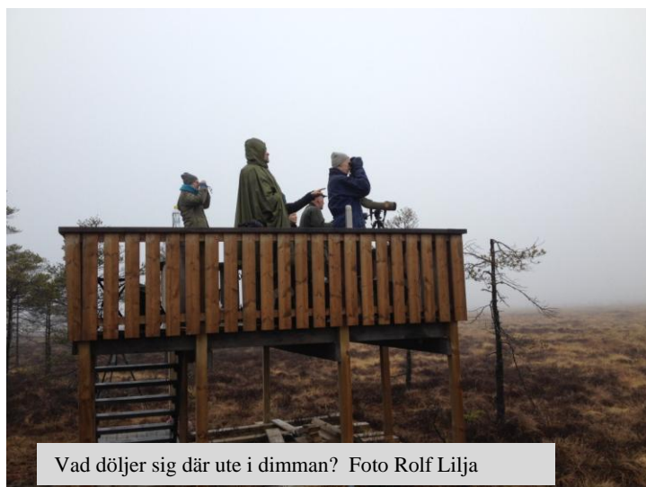
Vad döljer sig där ute i dimman?

Lördagsmorgonen den 16 april blev tyvärr en sådan där morgon då dis, dimma och lite lätt duggregn gjorde att både människor och djur kanske kände sig lite lätt mollstämda. Man brukar ju säga att det inte finns dåligt väder utan bara dåliga kläder men åt sikten är det svårt att göra något. Trots detta kom hela 15 personer och samsades om utrymmet i vårt nybyggda fågeltorn. När besvikelsen på vädret dämpat sig lite, började man inse att även ett besök på flyet i