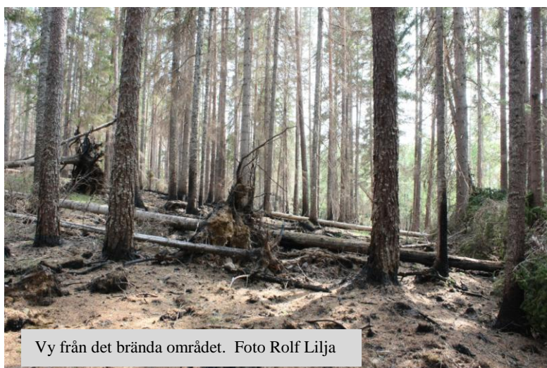
Vy från det brända området.

och skällavar som tillsammans med toppmurkla och korsört är några av de arter som redan börjat växa på marken. Runt om hördes konsert från alla försommarens sångare, framför allt lövsångare, bofink och svarthätta. Särskilt roligt var också att höra flera grönsångare samt ett par göktytor uppe vid gården.